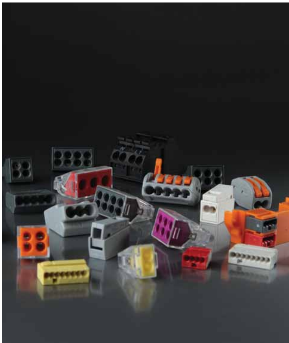
Клеммные зажимы «Wago» Клеммники КЗВ